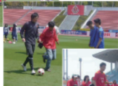
Wトレーニング シュート