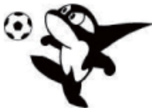
グランパス君もアスリートと いっしょに楽しみました