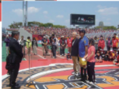
記念品贈呈とお礼のことば