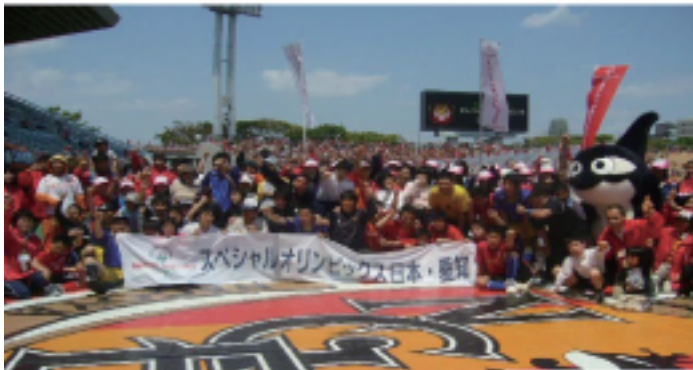
2010( 5) 1日(土) 於:瑞穂陸上競技場 アスリート:40人、ボランティア:70<