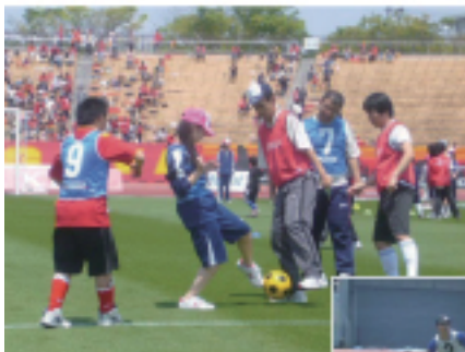
R b/c ボールの奪い合い