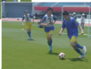
b/cf 中盤でのドリブル突破