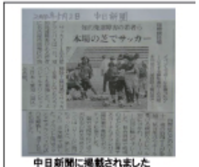
中日新聞に掲載されました