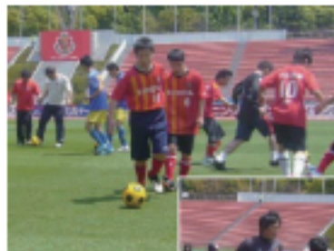
Rトレーニング ボールキープ