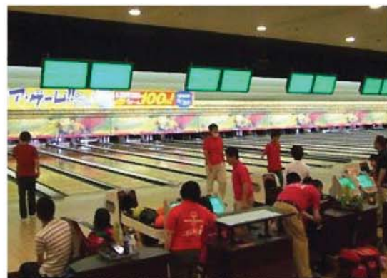
参考：SON・愛知資料より

コーチクリニックは、プログラムへの参加経験や競技経験の無い方でも参加できます。何か始めたい方、スポーツを楽しみたい方大歓迎です。次回のコーチクリニックにも多くの皆さまの参加をお待ちしております。