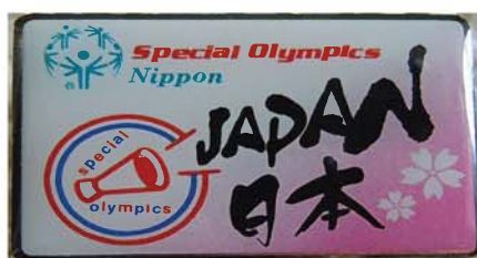
●角タイプ 20 X 30mm

※バッチ1個につき200円の寄付金は、SO日本地区組織支援金とさせていただきます。