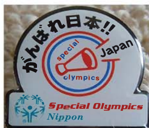
●丸タイプ 24 X 25mm

エールバッジは、丸タイプと角タイプがありますが、SON・愛知では、2個1セットとして1,000円で販売しています。購入金額のうち400円が支援金となります。購入を希望される方は、事務局までお申し込みください。数量限定のため、なくなり次第販売終了となります。