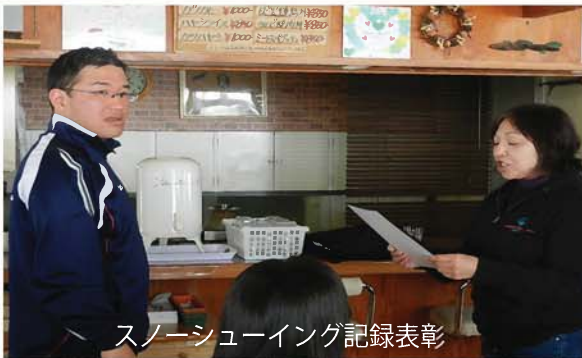
スノーシューイング記録表彰