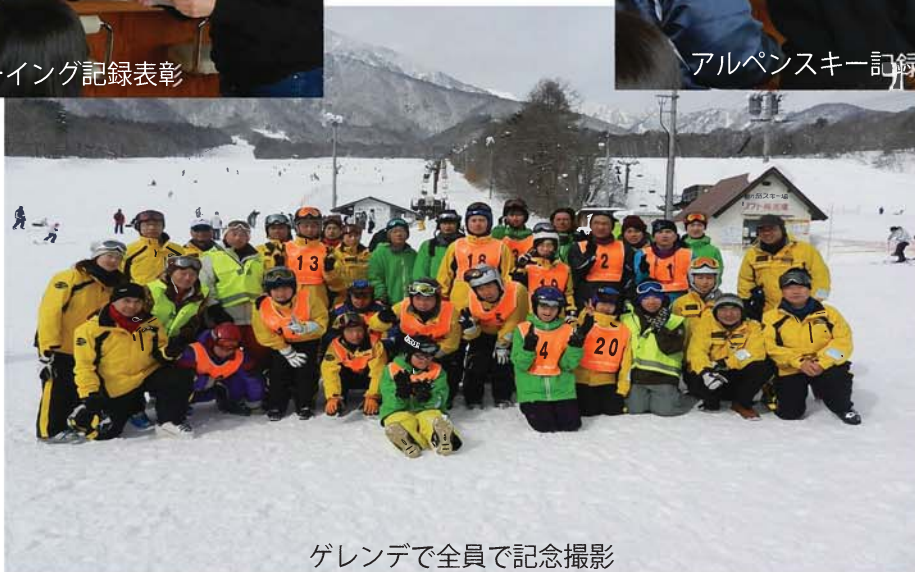
ゲレンデで全員で記念撮影