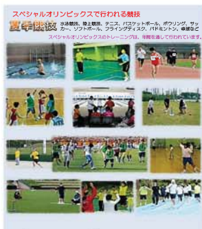
競技会は個人の成業を称える場です スペシャルオリンピックスの競技会やイベントには、知能障害のある人たちが多く参加しています。その中には、オリンピック選手と同等のレベルで競技している人もいます。また、知的障害のある人は、スポーツを通して心身の健康を維持し、社会参加の機会を得ています。

最新の写真を掲載した、パンフレットが完成しましたのでご案内します。 掲載内容の見直し、写真の更新を中心とした変更です。 パンフレットは、事務局に在庫していますので、必要な方は事務局まで 連絡下さい。