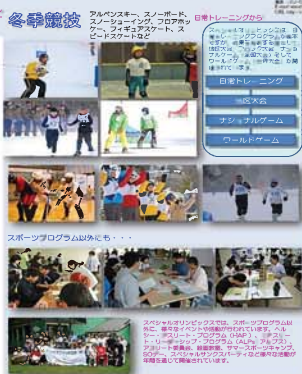
スポーツプログラム以外にも、...