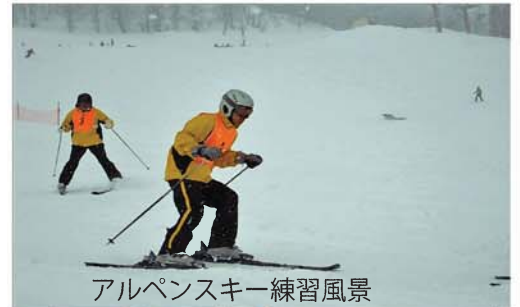
アルペンスキー練習風景