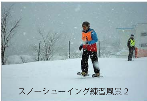
スノーシューイング練習風景 2