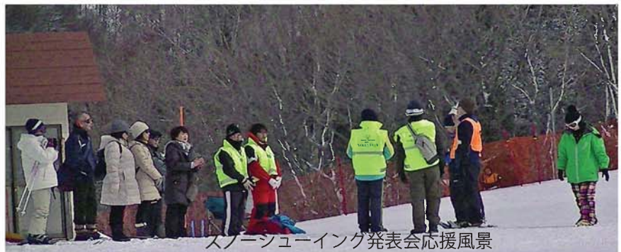
スノーシューイング発表会応援風景