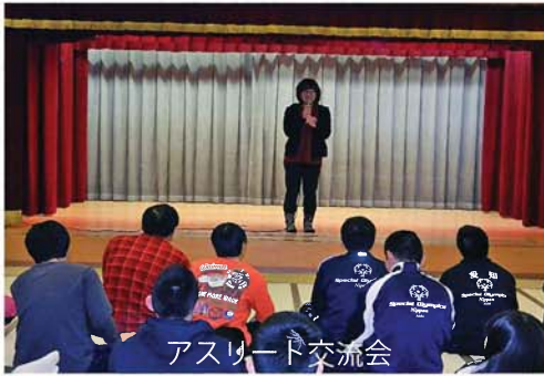
アスリート交流会

冬季スポーツプログラムは、合宿形式で行われるため、食後のお楽しみとして、アスリート交流会を行っています。食後、大広間に集まって、自己紹介（参加者全員）をして、お互いに親睦を深めるイベントです。最初は、自己紹介を嫌がっていたアスリートも、他の仲間が、次々と発表するのを見て、負けじと頑張って発表をし、その場の雰囲気盛り上げていました。今年は、若いボランティアの皆さんの参加があり、アスリートたちも楽しそうでした。