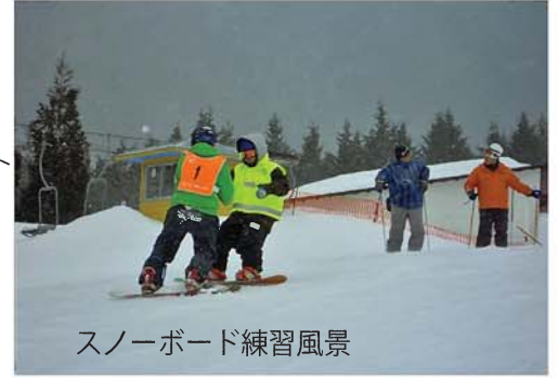
スノーボード練習風景

スノーボードは今回、アスリート1名の参加でした。今年は基本的な練習を多めにプログラムに取り込み、トレーニングを行いました。アスリート・コーチ共に基礎を見直す良いプログラムができたと思います。また、プログラム最後の発表会では、アスリートの成長した滑りを見ることができました。参加しているアスリートは、スノーボードをすることが初めての人がほとんどでした。そのアスリートたちが毎年上達していき、滑れるようになっていきます。是非皆さんもスノーボードに参加しませんか。アスリートもコーチもスノーボードの技術を問わず、大募集です。よろしくお願いします。