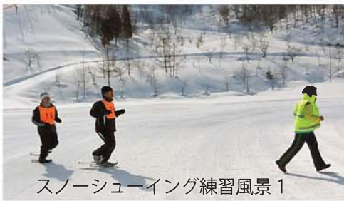
スノーシューイング練習風景 1