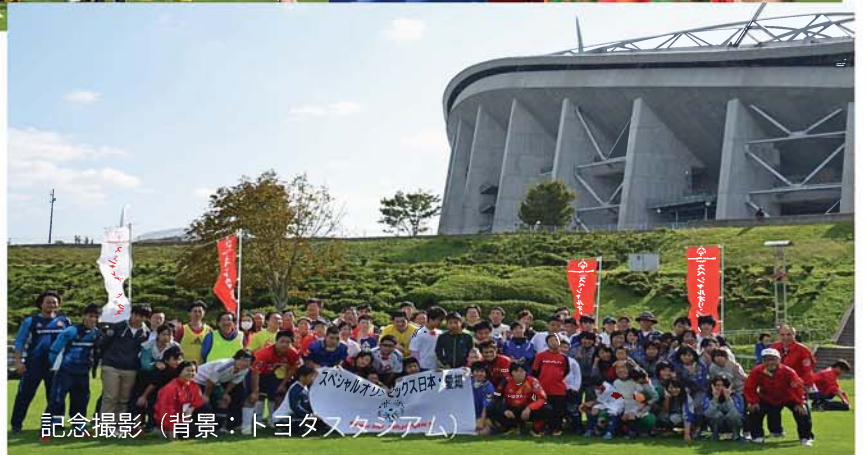
記念撮影（背景：トヨタスタジアム）