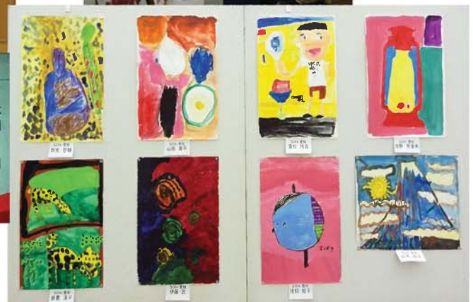
SON・愛知アスリート出展作品