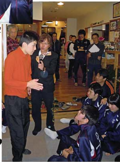
司会者と答えるアスリート