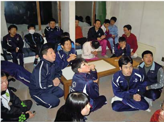
アスリート交流会風景 1

合宿でアスリートの交流を図る場として、アスリート交流会が夕食後、開催されます。アスリート交流会の目的は、人前で意見を発表する場を提供することです。プログラム中は、競技別に分かれています。アスリート全員が集まってコミュニケーションをはかります。