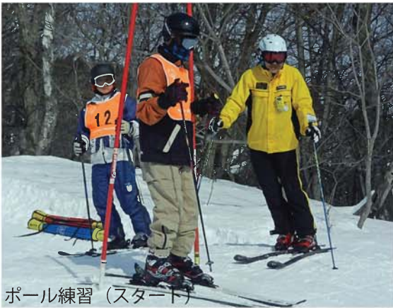
ポール練習（スタート）