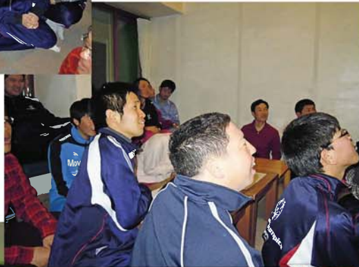
アスリート交流会風景 2