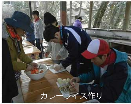
カレーライス作り