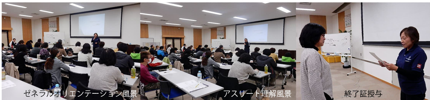
ゼネラルオリエンテーション風景

2015 年はこの他に、ボウリング、テニス、スケートの競技別コーチクリニックを予定しています。詳細、申込み等はニュースレターで案内します。多くの方の参加をお待ちしています。 (SON・愛知スポーツプログラム委員会)