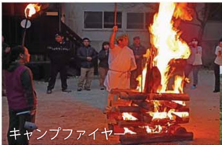
キャンプファイアー