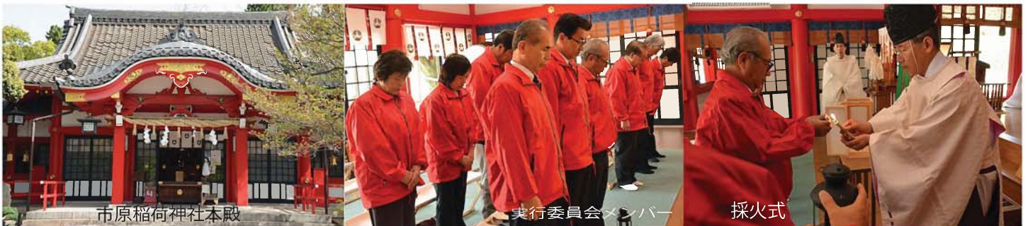
市原稻荷神社本殿