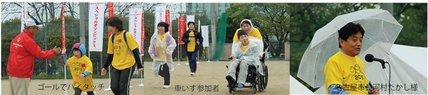
ゴールでハイタッチ