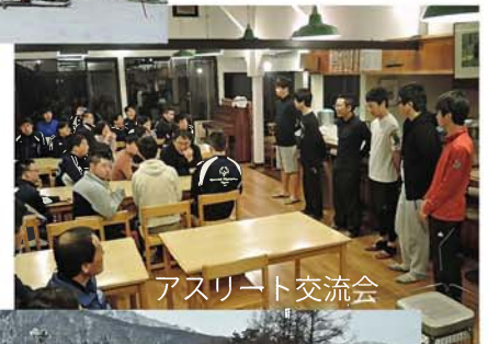
アスリート交流会