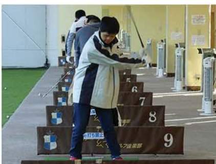
アイアンショット