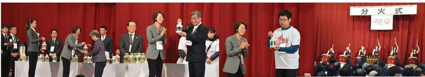
<Unified Relay トーチラン>