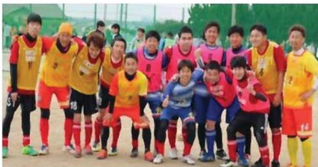
ビーチサッカー部の皆さんと記念写真