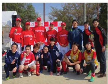
トヨタ運動部の皆さんと記念写真