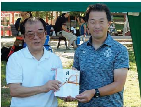
観戦チケット贈呈式