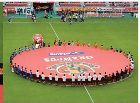
ナショナルゲーム PR ブース & ユニファイドボール