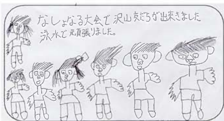
アスリート 瀧上 雅恵

陸上競技 5000m に出場しました。全力であきらめず走りました。5000m はきけんになってしまいました。100×4 に出場しました。バトンパスがうまく行ってゴールできて良かったです。（アスリート 小川 真輝）