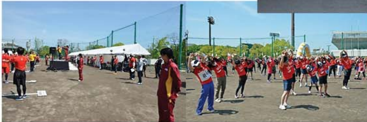
名城大学女子駅伝部の皆さんと準備体操