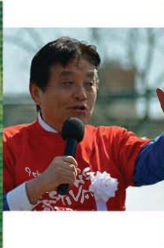
河村たかし名古屋市長