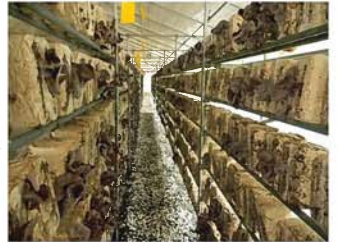
きくらげ農園・内部

春日井ファームは県営名古屋空港の近くにあり障がい者の方が2名就労しています。きくらげは多い日で2トンもの生産量があり毎日、収穫や乾燥、発送といった仕事をしているそうです。きくらげ2トンって想像できませんよね！ちなみに、きくらげはビタミンDや食物繊維・カルシウム・鉄分など栄養が豊富で、特にビタミンDは免疫力アップにとっても良いそうです。くわえて、ここで生産されるきくらげは、農業を使用せず育てた安心・安全なものです。また、きくらげは日本で流通しているほとんどが中国産の乾燥品だそうですが、こちらでは収穫した生のきくらげも販売しています。肉厚で食感も格別です。