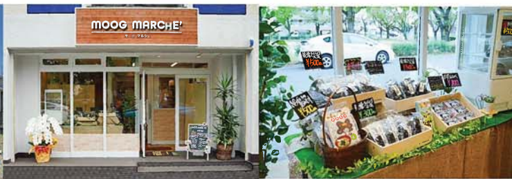
「MOOG MARCHE」（モーグ・マルシェ） 外観・内部