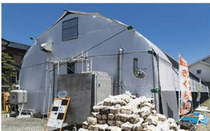
きくらげ農園「春日井ファーム」

障がいがある人とない人が特別に区別されることなく、地域で生活をともにできるノーマライゼーション社会の実現に取り組まれているホンダロジコム株式会社様に敬意を表するとともにSON・愛知も知的障がいのある人のスポーツを応援していきます。