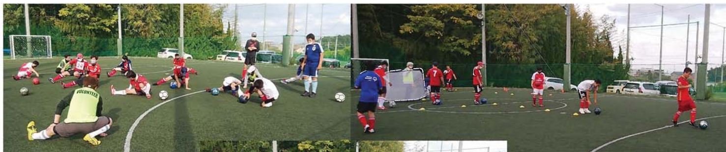
豊田会場練習風景

プログラムの運営でもビブスやボールなどフットサル場の備品を借りることができ、洗濯などの負担が少なくなりました。来期は、全員が参加できる状況になることを祈っています。