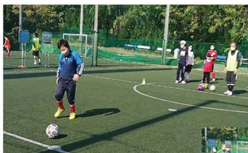
名古屋会場練習風景

名古屋会場のアスリート達は今まで体育館を使用して練習していましたがフットサル場を2面確保することができ、両会場とも広いスペースで練習できました。