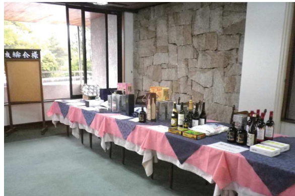
(写真3) ランク別 賞品の数々