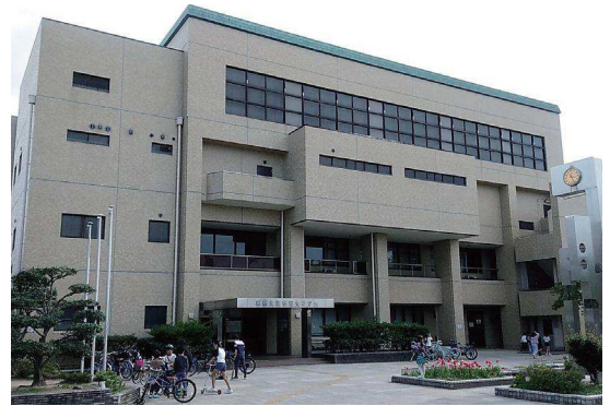
瑞穂生涯学習センター