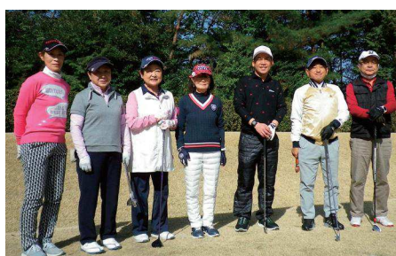
中コーススタート1・2組のメンバー