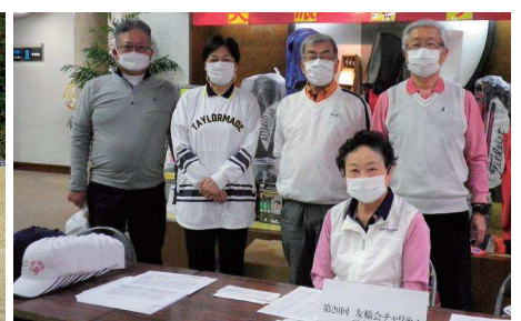
友輪会 受付メンバー