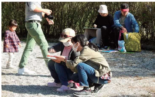
写生しているところ