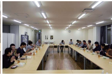
生活スキルの確認