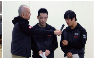
大会に向けての抱負