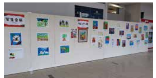
絵画展を同時に開催