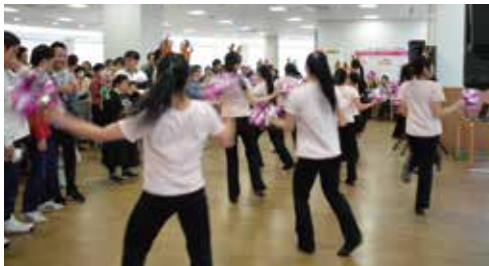
市邨中学校・高等学校バトン部の皆さん

スペシャルサンクスパーティーは、アスリートとファミリーからコーチ、ボランティアさんへ感謝の気持ちを伝えよう、と名づけられたと記憶しています。今はお互いに「ありがとう」を伝え合い、共に一年を振り返り、楽しい時間を過ごす大切な場です。息子の年間行事計画にはデフォルト設定になっています。今回も素晴らしい時間をありがとうございました。コーチ、ファミリーの皆さんの懐かしいお顔に会えて、嬉しかったです。