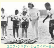
ユニス・ケネディ・シュライバー夫人

1962年、故ケネディ大統領の妹ユニス・シュライバーは、当時スポーツを楽しむ機会がなかった知的障がいのある人たちにスポーツを通じ社会参加を応援する「スペシャルオリンピック」を設立。